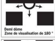
Demi dôme Zone de visualisation de 180°