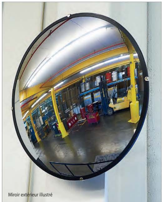
Miroir extérieur illustré